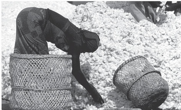
Marché au coton près de Berem au sud de N'Djamena

Pays enclavé, le Tchad paye le prix fort pour importer de nombreuses denrées soit par avion, soit par camion depuis le lointain port de Douala au Cameroun. Désertique au nord et agricole au sud avec une filière coton, « l'or blanc », tributaire des aléas des cours mondiaux (près de 2 millions de personnes concernées), le Tchad reste pauvre économiquement. À la différence des grands royaumes sahéliens, la résistance au colonisateur européen dans les années 1900 n'est pas très forte car les peuples habitant la région, trop divisés, sont peu organisés. Depuis son indépendance, le pays a traversé vingt ans de guerre civile et fait face aujourd'hui à la crise du Darfour qui a poussé plus de 200 000 réfugiés soudanais sur son territoire. L'engagement du gouvernement actuel de réserver 70 % des revenus pétroliers à la réduction de la pauvreté n'a pas été respecté : ils ont été affectés aux dépenses militaires.